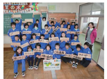
メッセージボード