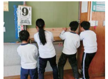
杉間伐材を貼る作業